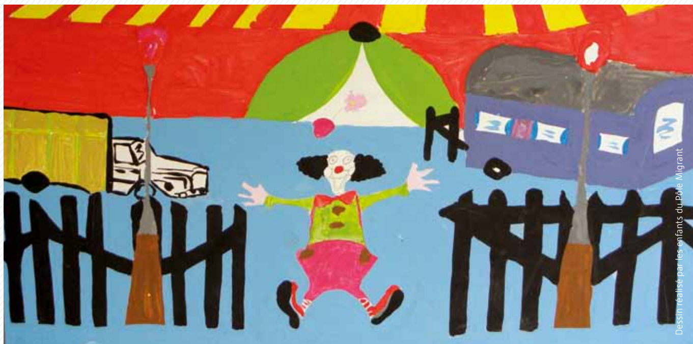
Dessin réalisé par les enfants du Pôle Migrant

Le 14 janvier 2013, nous avons reçu l'arrêté de la DGAS portant autorisation de création de 7 places d'accueil pour les femmes enceintes, les mères isolées et les parents d'enfants de moins de 3 ans. Cette nouvelle structure s'est ouverte en avril 2013.